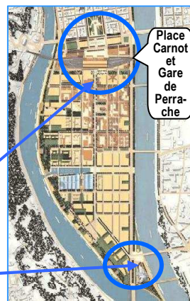
Musée des Confluences Conseil Général du Rhône