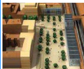
Place des Archives (derrière Perrache)

Pour de plus amples informations concernant « Confluence », vous pouvez consulter le site internet de la Ville de Lyon : www.lyon.fr , rubrique « Urbanisme » puis « Grands Projets ».